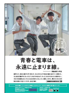
[「欠かせません」ポスター]