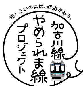
[プロジェクトロゴ]