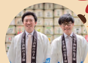
漫才師・にほんしゅ

北播磨の農と食と文化が一同に集う、北播磨農と食の祭典が開催されます！ 生産者グループや高校生が北播磨の野菜やお米、巻寿司、山田錦を使ったスイーツ等を販売するほか、団体や地元の酒造による日本酒の展示販売、紙すき体験など、約30ブースで北播磨の農と食、地場産業に触れていただけるイベントです。是非この機会にお越しください！