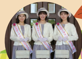
フラワープリンセス

北播磨の農と食と文化が一同に集う、北播磨農と食の祭典が開催されます！ 生産者グループや高校生が北播磨の野菜やお米、巻寿司、山田錦を使ったスイーツ等を販売するほか、団体や地元の酒造による日本酒の展示販売、紙すき体験など、約30ブースで北播磨の農と食、地場産業に触れていただけるイベントです。是非この機会にお越しください！