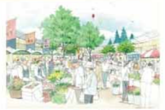
様々な仕掛けが多様な人と人の「交流」を生む