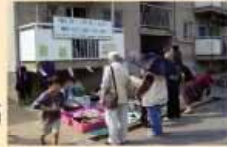
サポートセンターで行ったフリーマーケットの様子

平成18年7月から県営明舞北鉄筋住宅の空き室に「神陵台まちづくりサポートセンター」を開設して、サポートセンターで行ったフリーマーケットの様子活動しています。