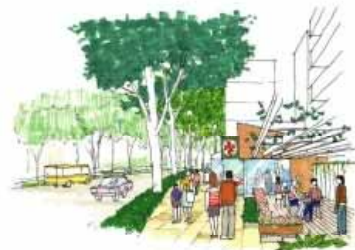
賑わい広場イメージ