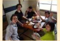
お待ちしております！！

平成18年6月から、県営明舞鉄筋住宅の空き室に「共生ステーションめいまい」を開設し、団地内のお年寄りや子どものための映画会やミニデイサービスなどの取り組みを進めています。ぜひ一度、遊びに来て下さい。