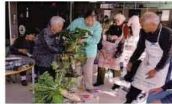
生きがいづくりを支援