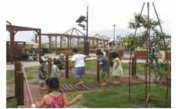
オープンスペースの活用