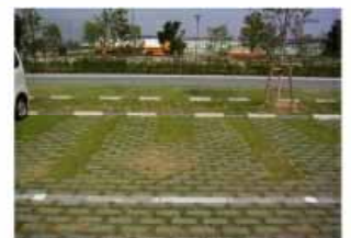
屋上緑化・グラスパーキング