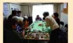
さんさんハウスの様子

松が丘三丁目有志によるボランティアグループです。平成18年4月から、松が丘三丁目自治会と共同で県営明舞南住宅の空き住戸を活用し、一人暮らしの高齢者を対象としたミニデイ活動「さんさんハウス」を開設しています。