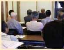
定期的に交流会を行っています

分譲マンションの管理についての情報交換を目的に設立したネットワークです。明舞地域のマンションにお住まいの方であればどなたでも加入することができます。管理組合運営に悩んでおられる方、マンション管理に興味のある方は是非ご参加下さい。