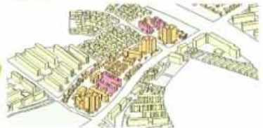
住区のコンパクト化・住棟の混在等のイメージ