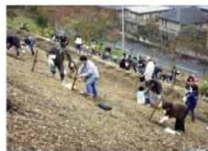
県民まちなみ緑化事業