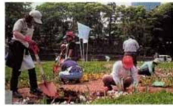
コミュニケーション広場のイメージ