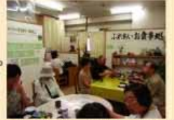
「ふれあいお食事処」の様子

平成15年10月より、地域内のボランティアが中心となり中央センター内に「ふれあい食事処」を開設。独居・虚弱高齢者への配食サービス、男性料理教室などの活動を行っています。