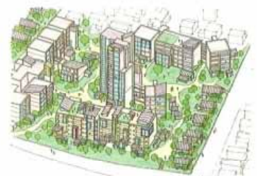
多様な住宅地の混在