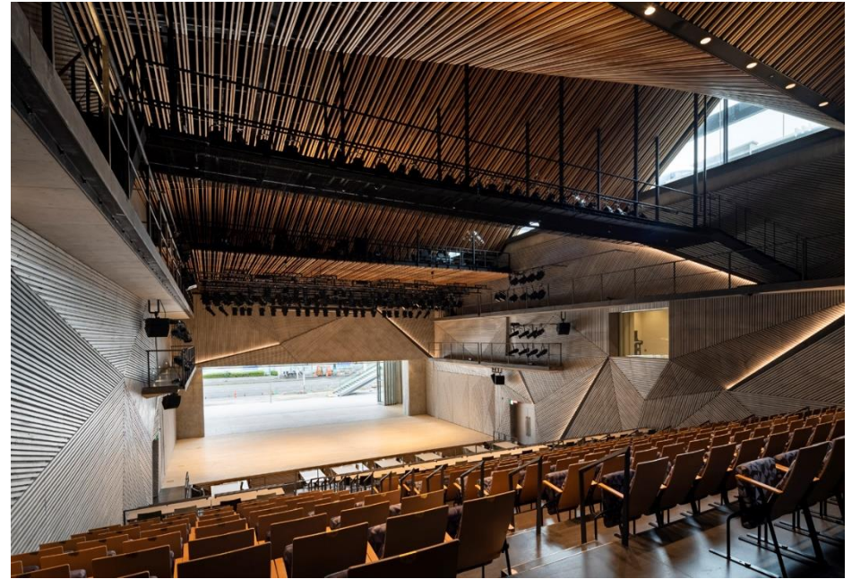
▲舞台が開放され、広場・多目的スペースと一体となるホール