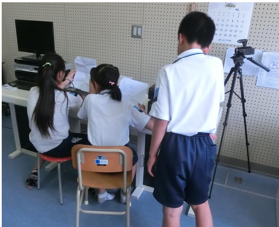
▲アニメ等子供にもわかりやすい題材で、防災について生放送