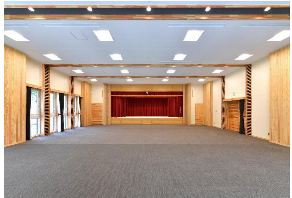
▲木の香りが漂う、温もりのある大会議室「久保井講堂」