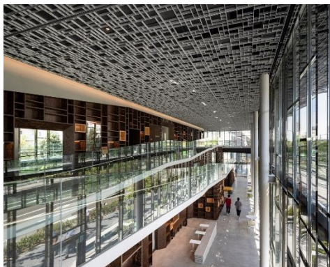
▲知と芸術を融合する交流モール