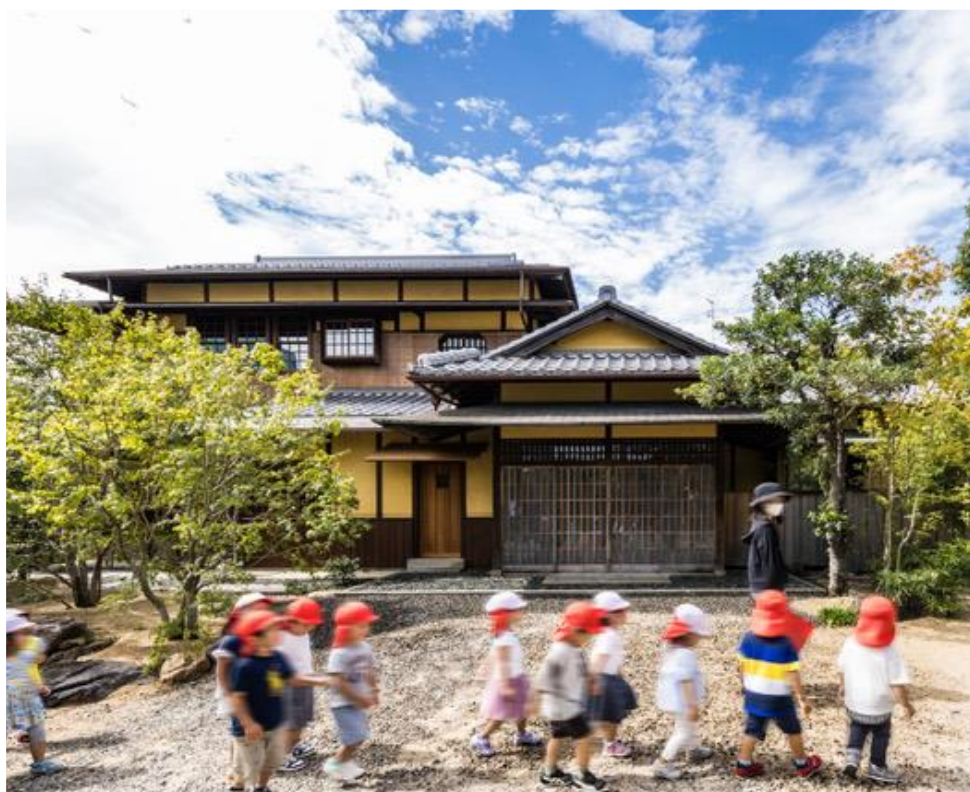
▲園児たちが日々過ごす環境の中に歴史的建造物がある