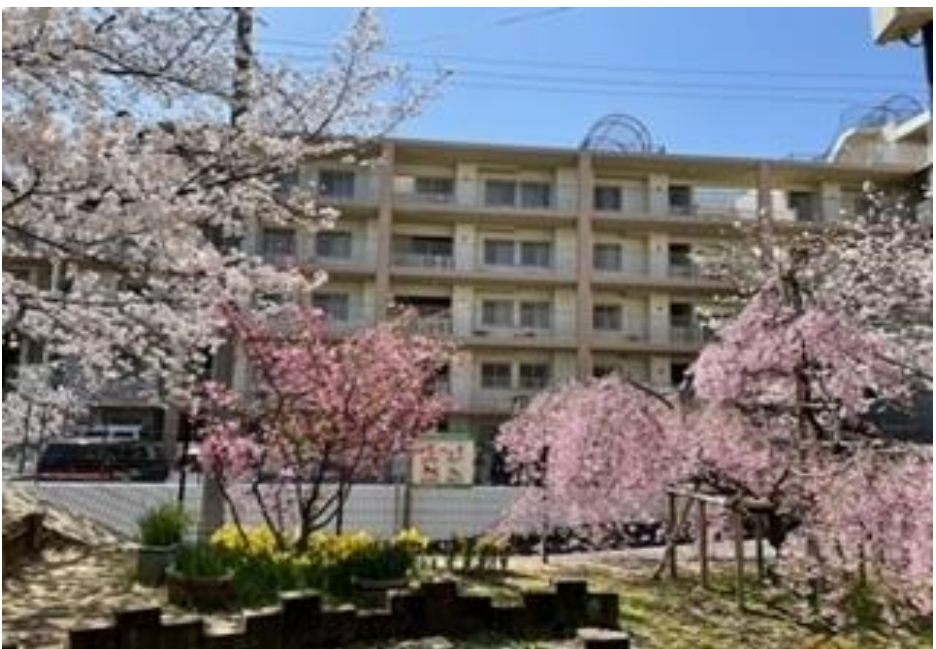
▲毎日クラブのメンバーが交代で維持管理を実施する公園