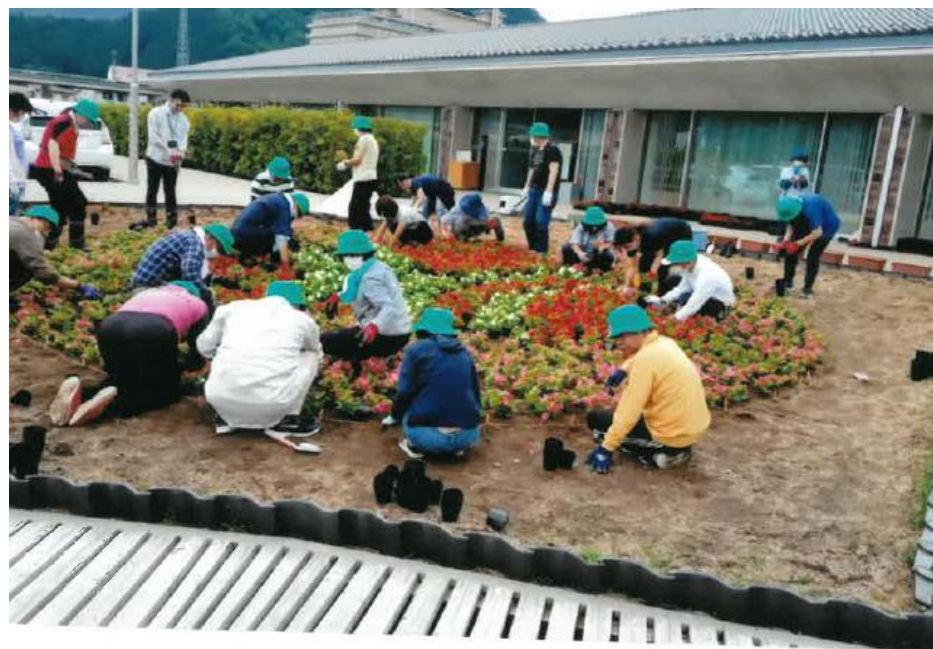
▲やぶ市民交流広場YBファブでの花壇整備の様子