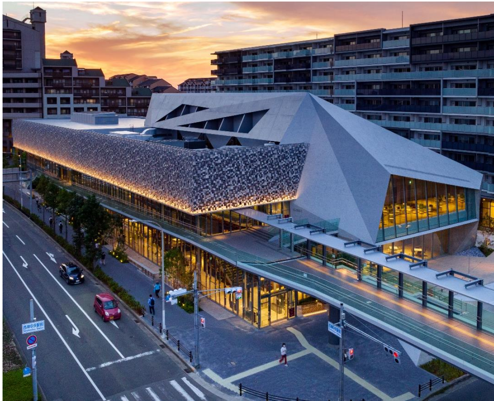
▲駅前のランドマークとなる神戸らしい外観