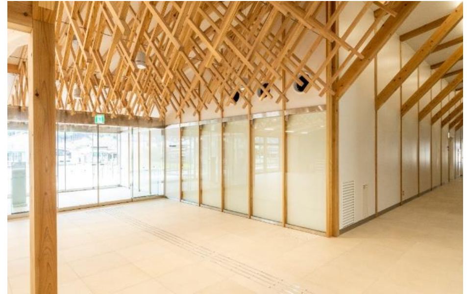
▲エントランスホール天井に設置した宍粟杉による格子細工