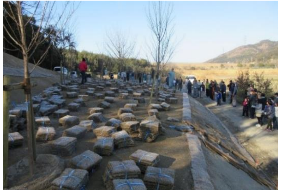
▲里山の景観保全のため植栽を実施