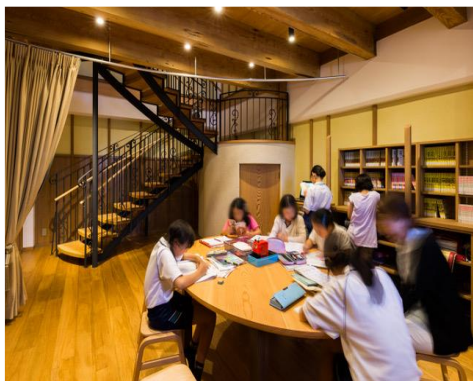
▲放課後、蔵に集まる卒園児たち