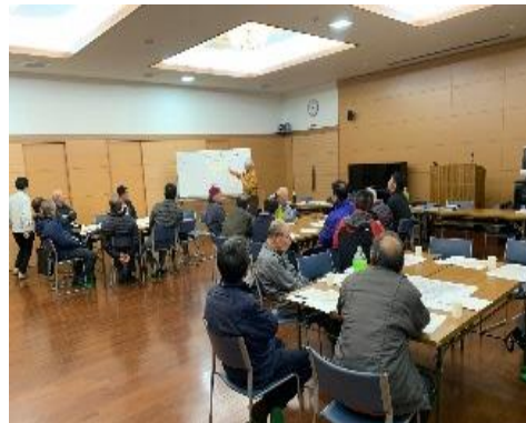
▲地区まちづくり計画策定の様子