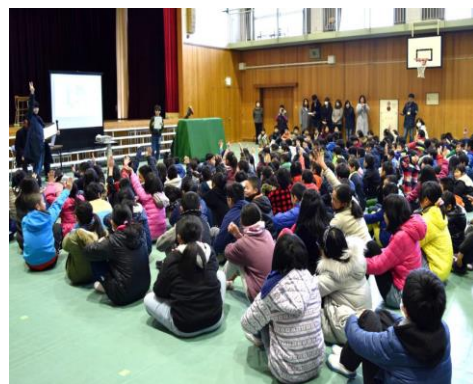
▲学んできた成果を保護者と共有