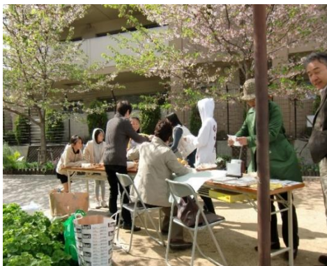
▲オープンガーデンの様子