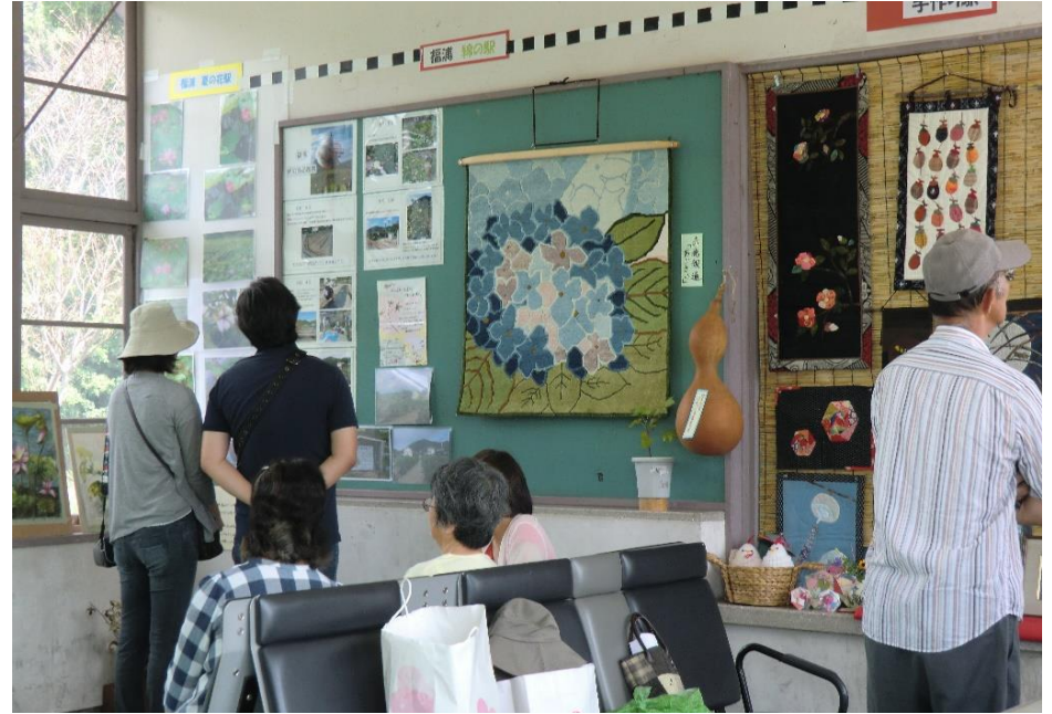
▲JR赤穂線の乗降客数増加を目指し、駅構内で作品展を実施