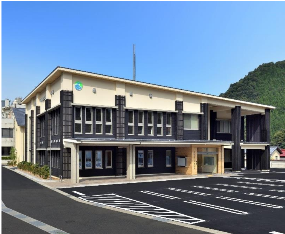
▲木質外装材、漆喰等の住宅が多い小代地域の景観と調和した外観