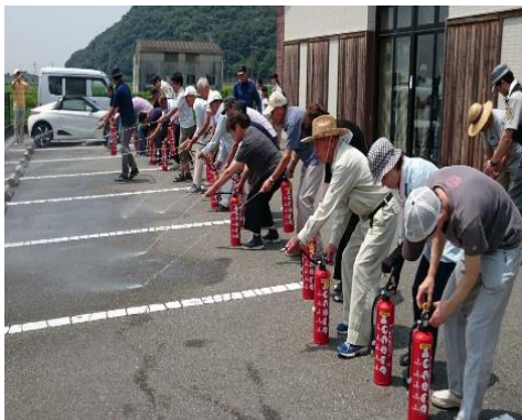
▲地域で消火訓練を実施