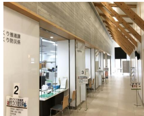
▲目届きのよい行政窓口