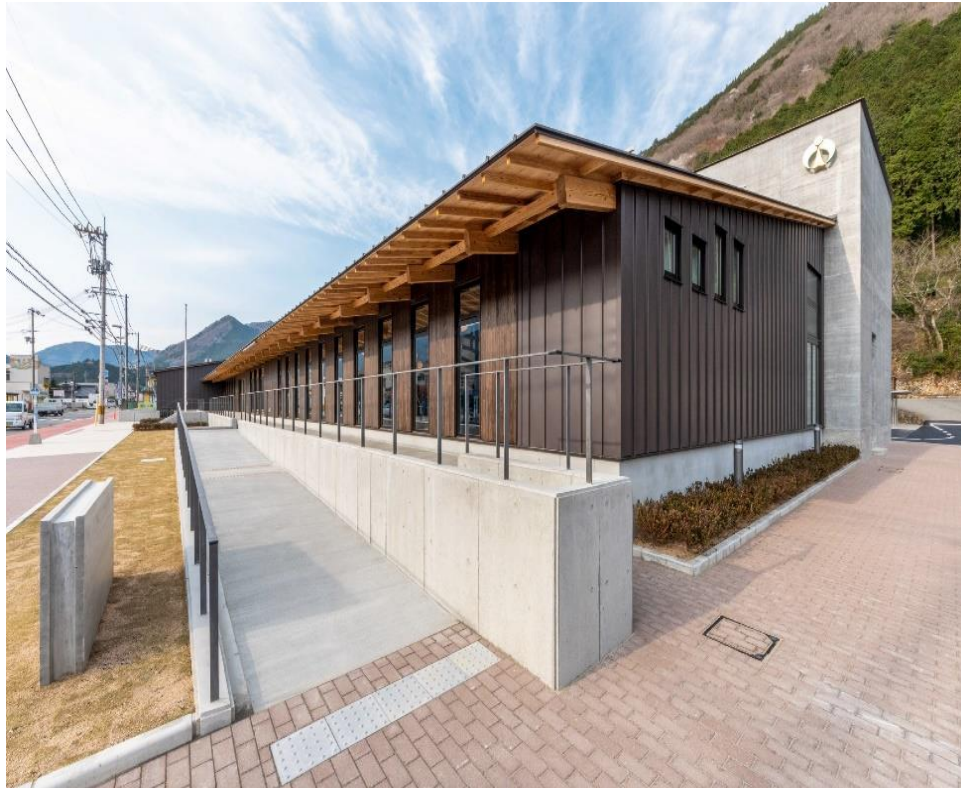
▲趣の異なる、木とコンクリートの調和・融合が図られた外観