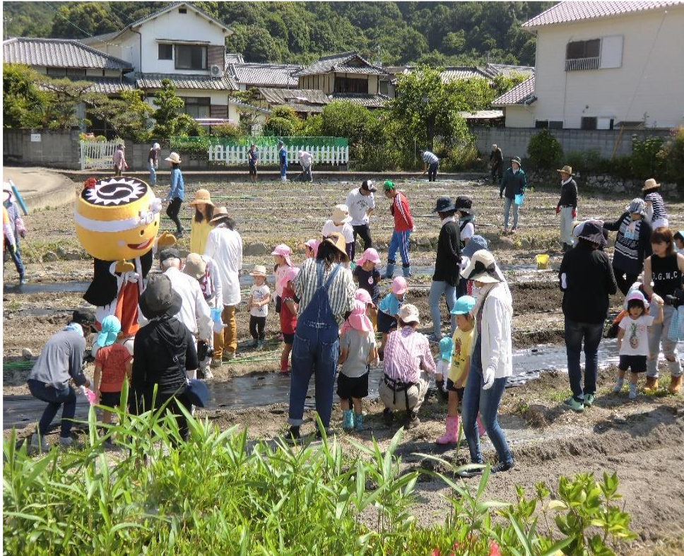
▲地元住民と一体となって綿の種まきを実施