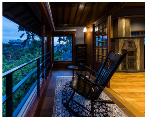
▲2階サンルームの様子