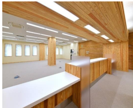
▲内外部にふんだんに木材を使用 ▲親しみ感のある受付窓口