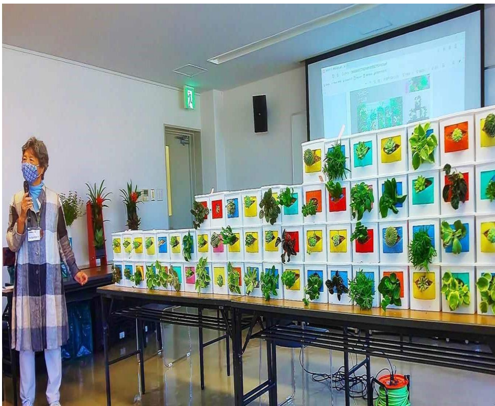
▲近隣の中学校、マンションでタテニワ講習会を実施