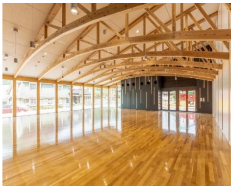
▲木造ハーフアーチ構造を採用