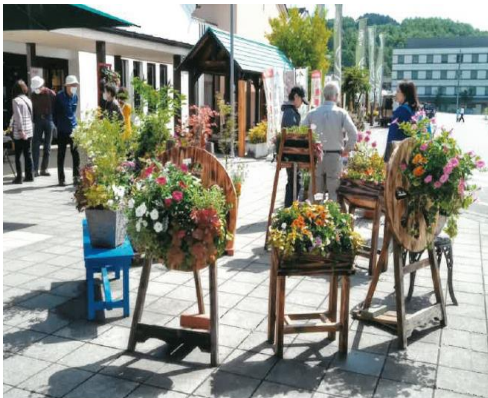
▲道の駅での作品展