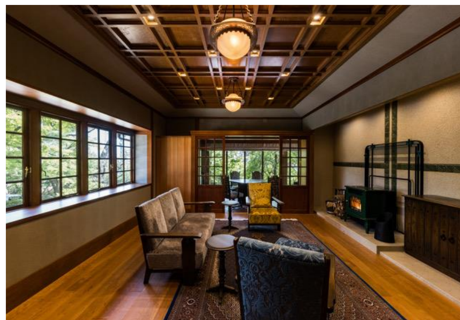
▲100年前の雰囲気は残しつつ新しいデザインも取り入れた改修