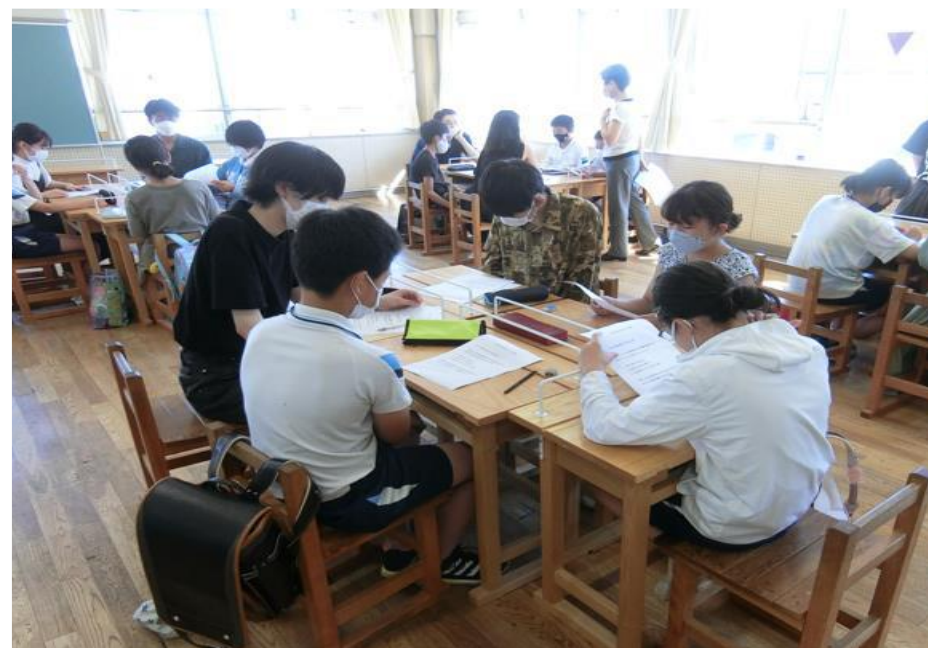
▲児童と大学生による放送内容の打合せ