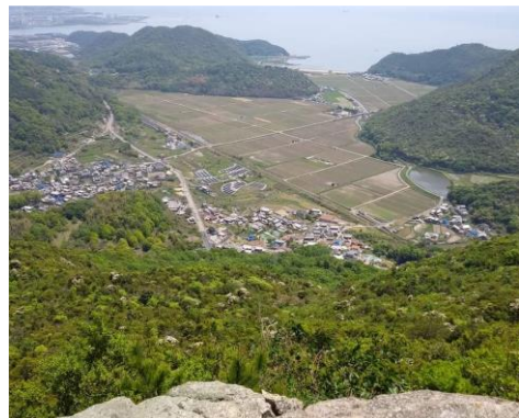
▲他団体とも協力し登山道を整備