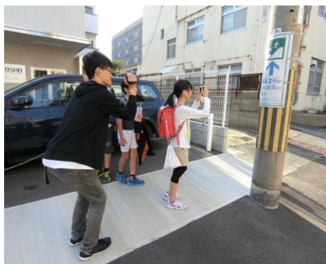
▲街なか防災探検の様子