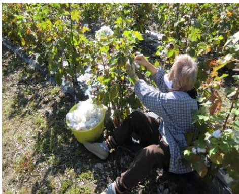
▲高齢者の見守りを兼ねた活動