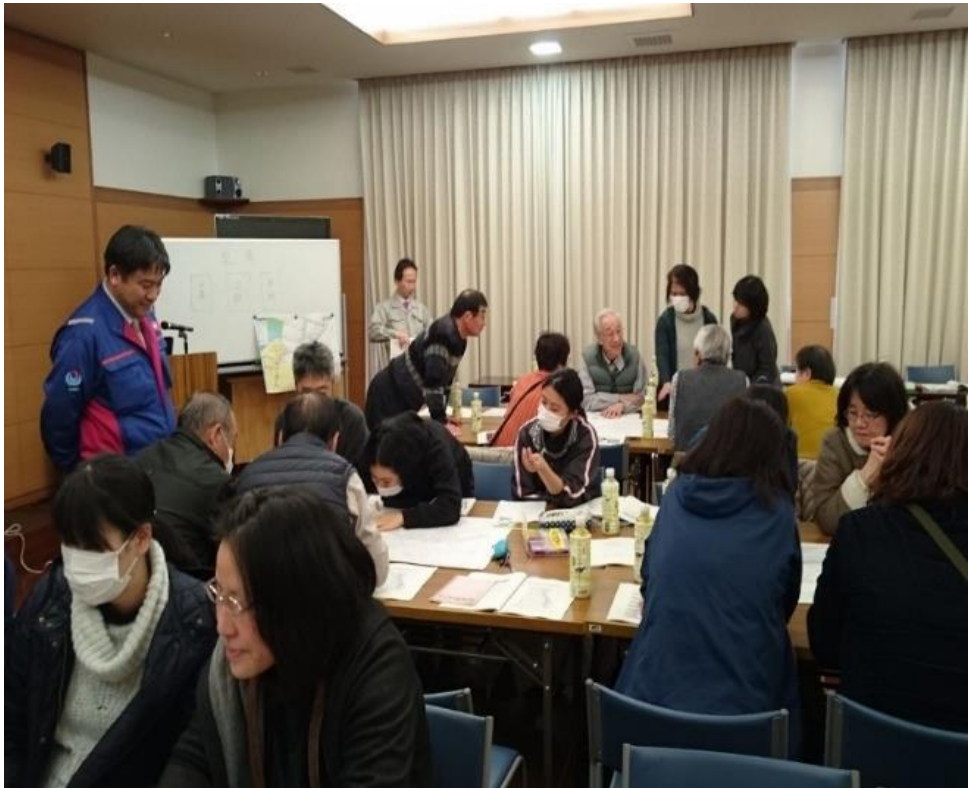
▲防災マップ・防災マニュアルを作成