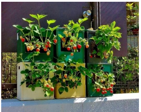
▲通園路に設置したタテニワ