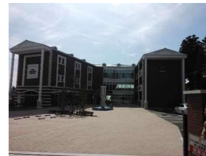
六甲山上遊休施設活用支援制度の活用による高級ホテルの新築