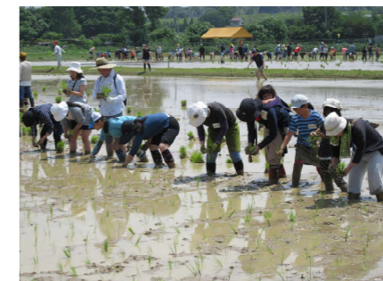
楽農交流事業による親子農業体験教室