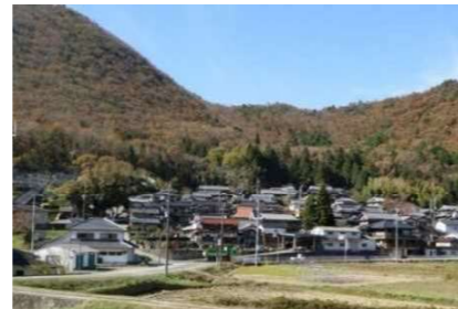
緑条例による計画整備地区の認定 (丹波篠山市 上立杭地区)