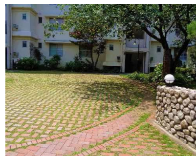
駐車場の芝生化 （県民まちなみ緑化事業）