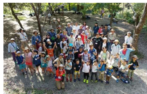
こども北摂里山探検隊 (北摂里山博物館ホームページより)