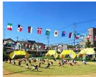
校庭の芝生化（県民まちなみ緑化事業）