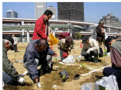
住民団体による緑化活動を通じたコミュニティ形成（県民まちなみ緑化事業）