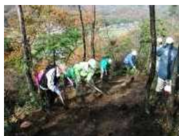
災害に強い森づくり事業（住民参画型森林整備）の実施