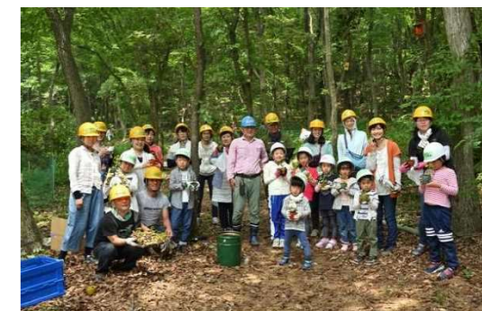
企業の森づくり事例（（公財）兵庫県緑化推進協会）