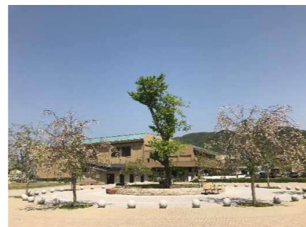
大規模都心緑化 （県民まちなみ緑化事業）