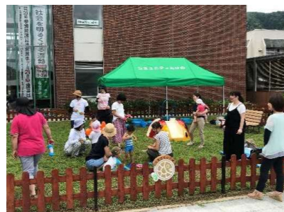
地域コミュニティ活動の場としての活用（県民まちなみ緑化事業）