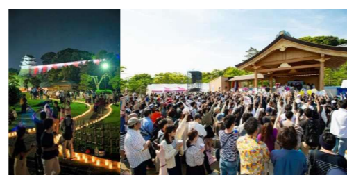
明石公園における明石城築城400周年記念事業 にかかるイベント開催