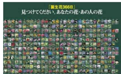
淡路花博20周年花緑フェアの開催