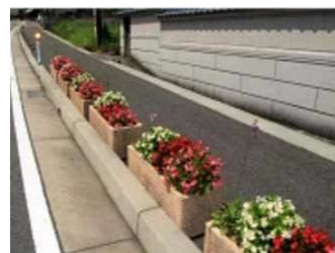
花のあるみちづくり事業