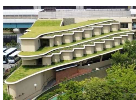
屋上緑化 （県民まちなみ緑化事業）