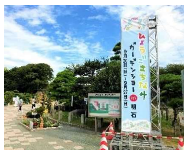
花緑センターによる普及啓発イベント