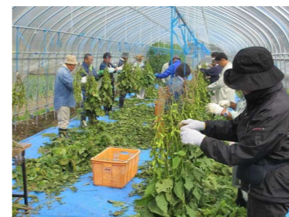
農村ボランティア（ふるさとむら活動支援事業）による都市住民と農山村の交流