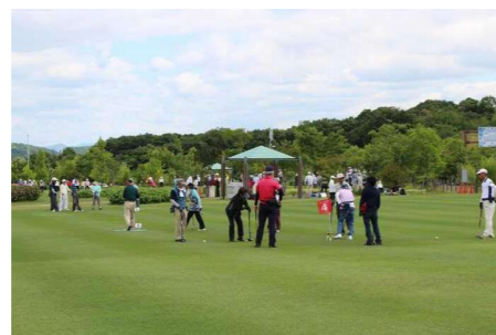
高齢者の健康づくりの場としての活用（グラウンドゴルフ大会、指定管理者HPより）