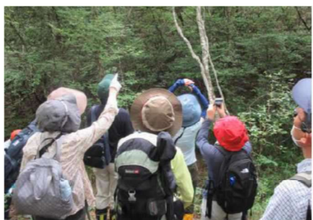
市民団体による里山保全活動（有馬富士公園）