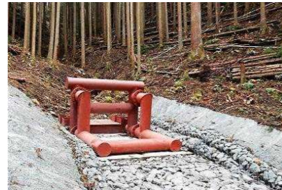
災害に強い森づくり事業（緊急防災林整備）