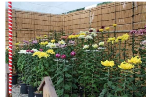
菊花展の開催（兵庫県フラワーセンター、指定管理者事業）