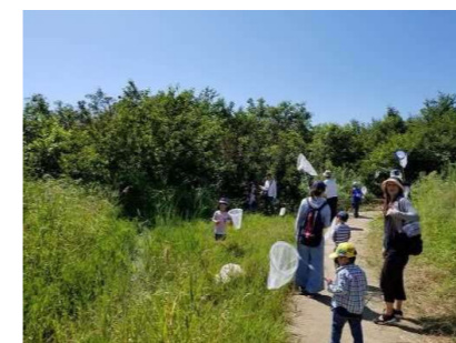
環境学習の場としての提供 (尼崎の森中央緑地)