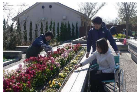
園芸療法認定を行う園芸療法課程