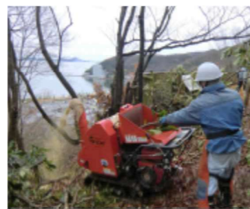
地域住民による伐採木のチップ化 (新ひょうごの森づくり)