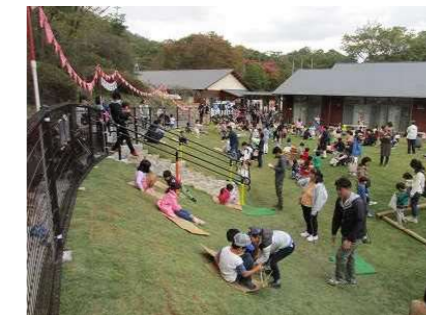
県立甲山森林公園パークセンターのリニューアル（甲山森林公園HPより）