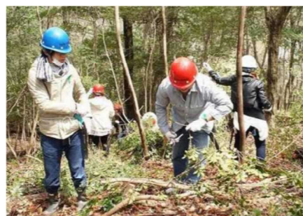
市森林ボランティア活動