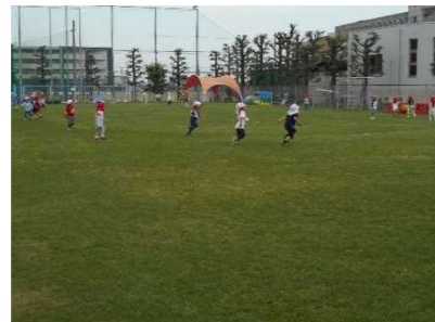
子どもの冒険ひろば（子どもの冒険ひろばFBより）