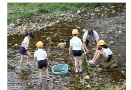
グリーンスクール表彰校の取組 (環境保全活動)