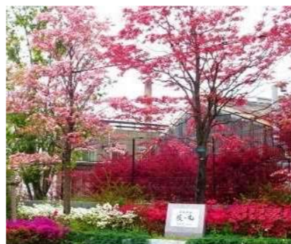
人間サイズのまちづくり賞（花緑部門）受賞例（日本製鉄株式会社 鋼管事業部 尼崎製造所）