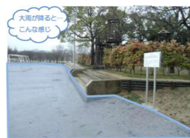
丹波年輪の里におけるグラウンドを調整池として活用した流域対策の実施