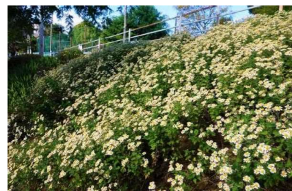
のじぎくの里づくり事業