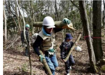
地域住民等による森林整備 (新ひょうごの森づくり)