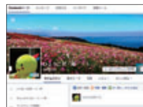
花緑に関する情報を発信しています!!

県花のじぎくの群生地づくり、普及のため、のじぎくの苗を希望する緑化団体等に提供します。