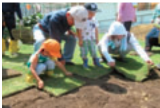
子どもたちと父兄と一緒に芝生を張りました。