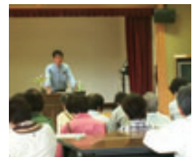
植栽計画に関する講習