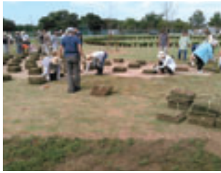
地域の広場に住民で協力し合って芝生を植えています。