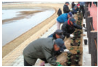
植栽活動や維持管理作業を通じて、地域住民の交流も活発になります。