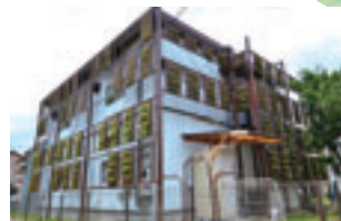
ヘデラやハツユキカズラなどによる基盤造成型の壁面緑化です。