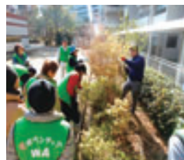
維持管理に関する現地講習