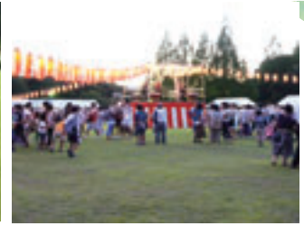
芝生化したグラウンドを夏祭会場として使用しています。