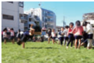
裸足で遊ぶ子どもたち、気持ちよさそうですね!!

概要 学校の校庭や幼稚園又は保育園の園庭を芝生化 ポップアップ式スプリンクラー、井戸等を設置する場合は、最大100万円まで加算!!