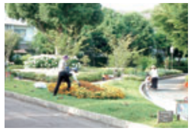
緑に囲まれた場所となることで心に安らぎを与え、うるおいのある空間となります。