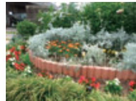
緑化資材の配布により整備された花壇