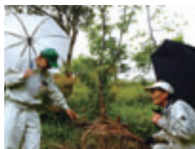
緑のパトロール隊によるアドバイス風景

県民まちなみ緑化事業で緑化した箇所などに、本庁、県民局土木事務所などに配置されている「緑のパトロール隊」による相談、アドバイスを行っています。