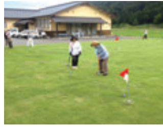
休日には大人たちがグラウンドゴルフ、子どもたちがキャッチボールを楽しむなど、幅広く利用できます。