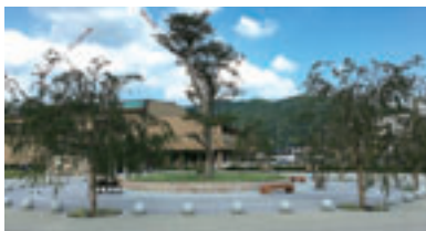
高さ15mを超えるエドヒガンは公園のシンボルツリーです。

川西市北部にある黒川地区から台場クヌギやエドヒガンを移植し、川西市が誇る「日本一の里山」をまちなかに再現しました。