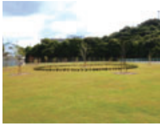
良好な維持管理を行うことで、周囲の景観向上にもつながります。