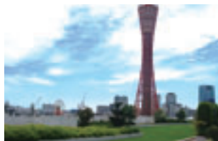
緑を感じながらバイサイドを楽しむことが出来ます。