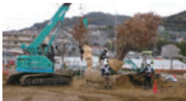
黒川地区の台場クヌギを移植しました。