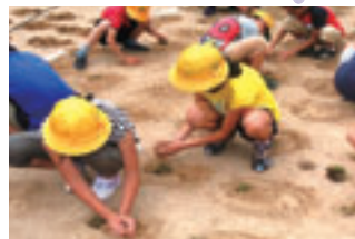
ポット苗の植え付けを行っている様子です。