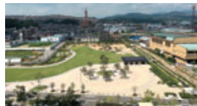
まちなかに日本一の里山風景が創出されました。

大規模都心緑化の補助内容 都心緑化計画に基づき歩行者空間を豊かにする緑化を行う協議会に対し、緑化に要する費用を補助します。