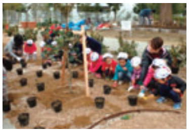
道路沿いの花壇に、子どもたちやボランティアの方々楽しく植栽を行っています。

例) 地域の自治会で公園にシンボルツリーや低木を植樹 住民団体がマンション敷地内に植樹 緑化活動グループで道路沿いに花木を植樹 など