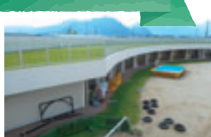
保育所の屋上を芝生化しています。