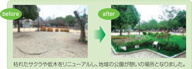
枯れたサクラや低木をリニューアルし、地域の公園が憩いの場所となりました。

アジサイ、バラ、ツツジ等の花木や低木も対象となります。一年草(アサガオ、コスモス、パンジー等)は対象となりません。