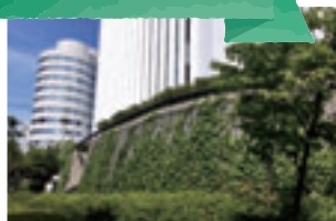
ヘデラによる登はん型の壁面緑化です。