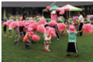
保育園の芝生化により、園児たちが一層元気になりました。