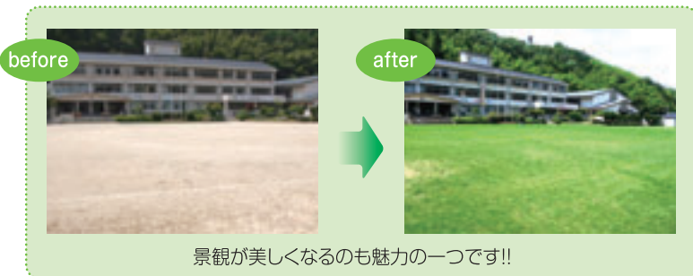
景観が美しくなるのも魅力の一つです!!