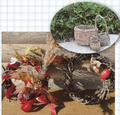
つるで編んだカゴやリース