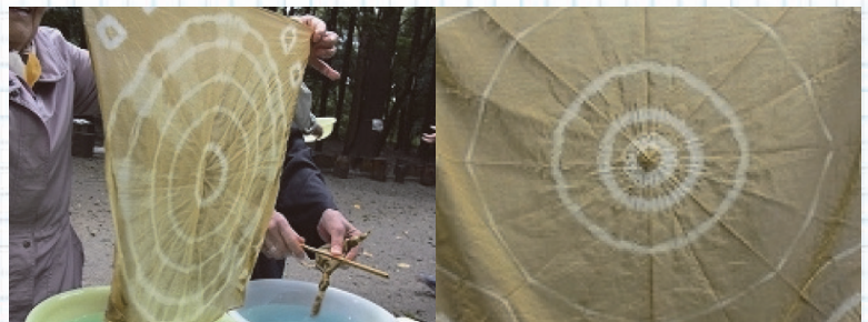
きれいに染まりました