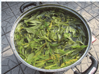
花と葉っぱを一緒に煮出します