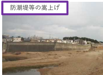
防潮堤等の嵩上げ