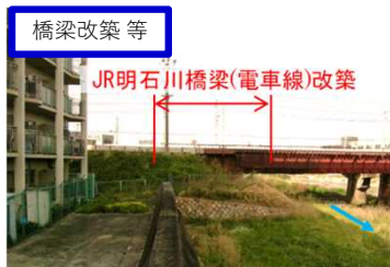
橋梁改築等 JR明石川橋梁(電車線)改築