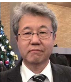
法政大学デザイン工学部 都市環境デザイン工学科 教授