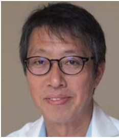
九州大学大学院 工学研究院 教授