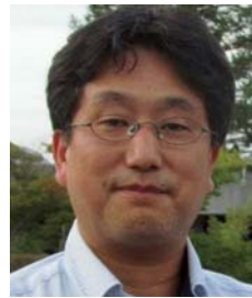
兵庫県立人と自然の博物館 主任研究員