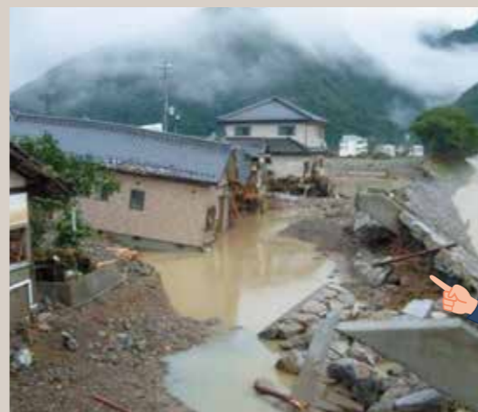
平成21年台風9号による被害 (千種川水系佐用川)