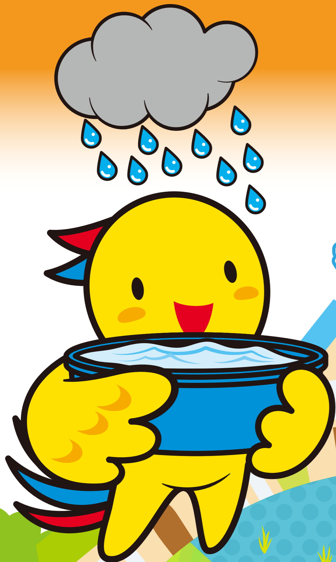
兵庫県マスコット はばタン