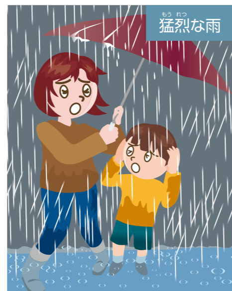
1時間雨量100mmのイメージ