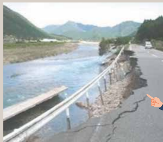
平成23年台風12号による被害 (加古川水系杉原川)