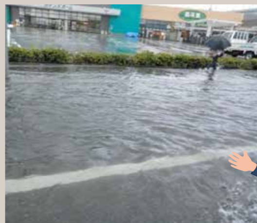
大雨で道路が水浸しになっている様子 (神戸市内)