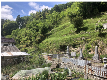
②保全対象とがけの状況