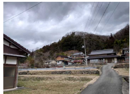
④保全対象とがけの状況