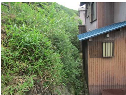
②保全対象とがけの状況