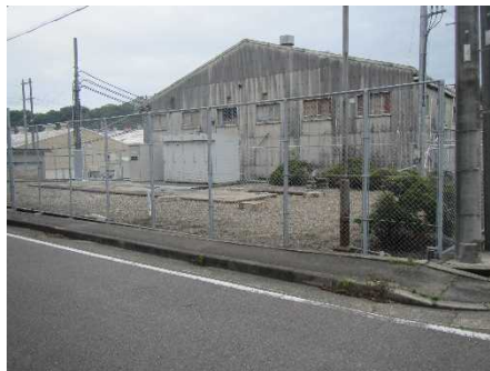
③保全対象(関西電力変電所)