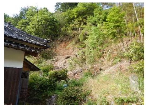
④斜面の荒廃状況(崩壊跡)