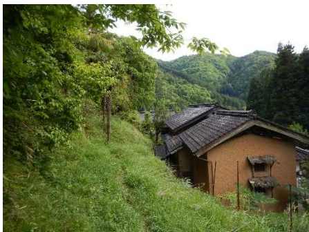
②保全対象とがけの状況