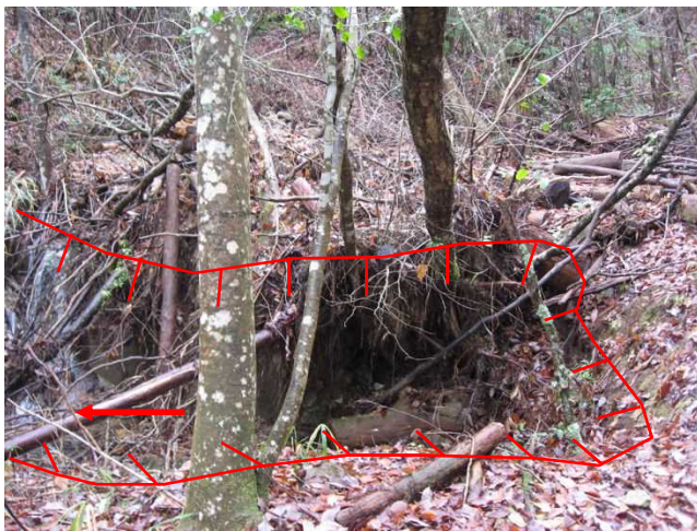
④溪流荒廃状況(土砂流出の痕跡)