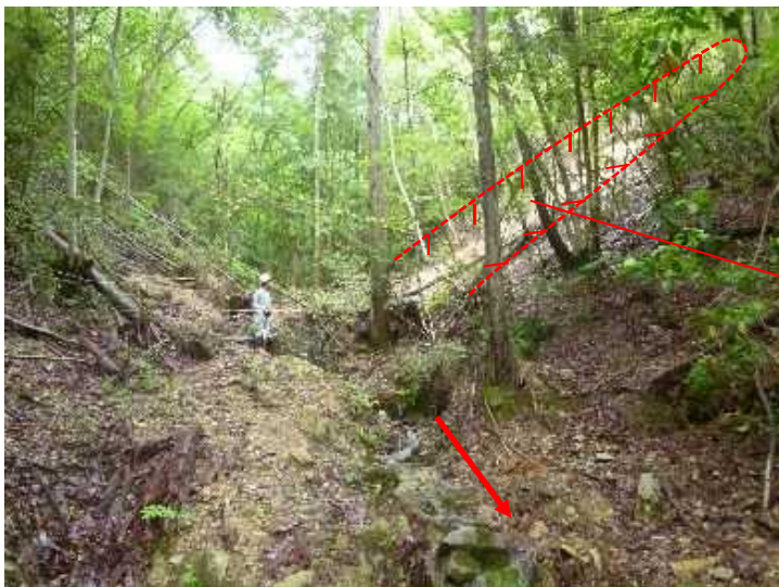
⑤溪流荒廃状況(土砂堆積状況)