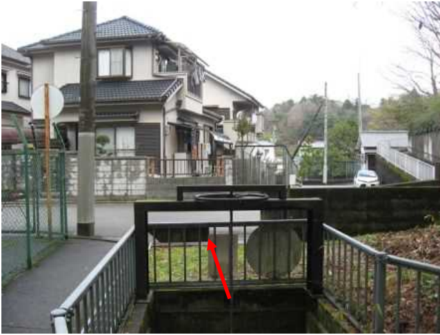
③谷出口付近の状況