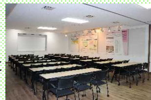
レクチャールーム