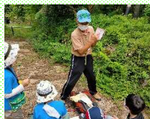
過去のプログラムの様子