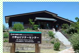
県立六甲山ビジターセンター