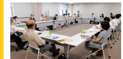
第1回新神戸地域ビジョン検討委員会