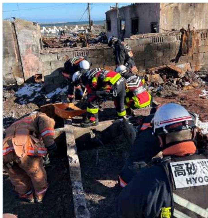
（輪島市河井町での搜索活動①）