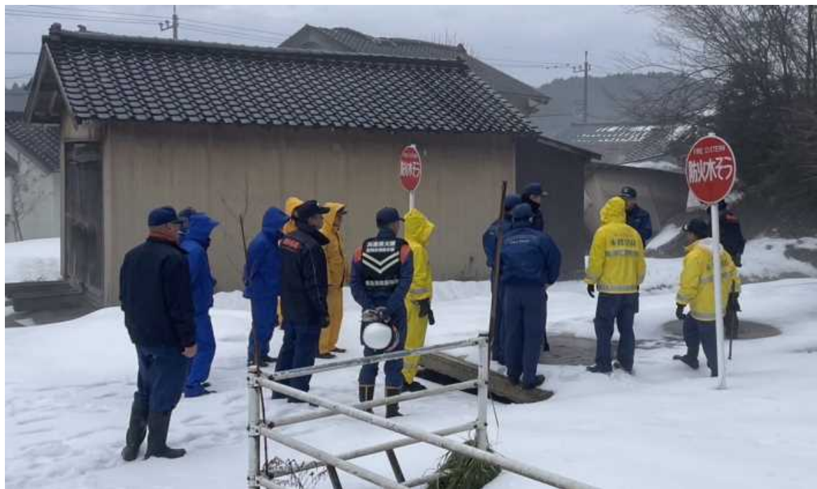
（消防署活動支援・防火水槽調査）