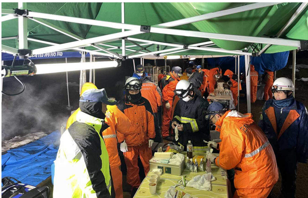
（宿営地での後方支援活動・食事）