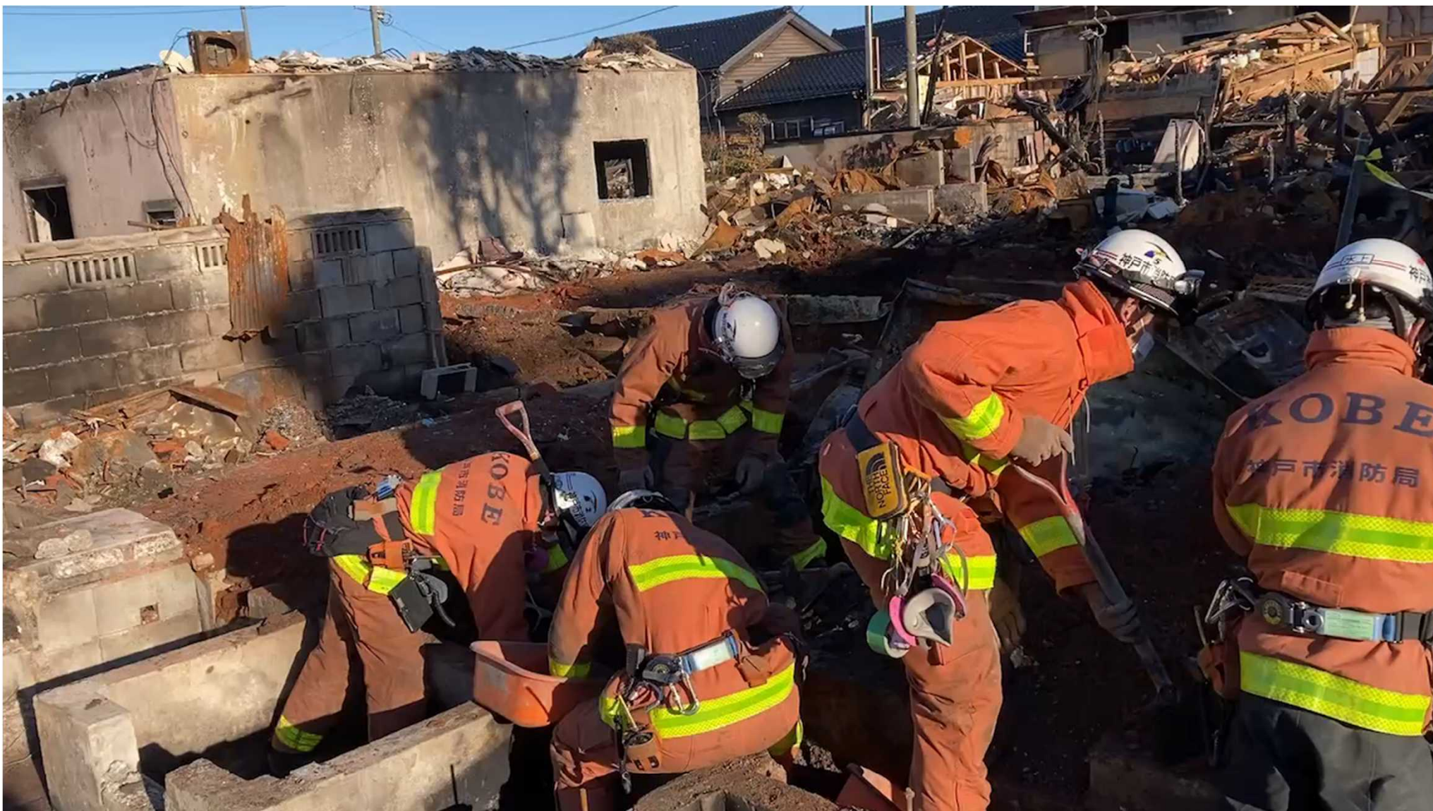
(輪島市河井町での捜索活動動画②)