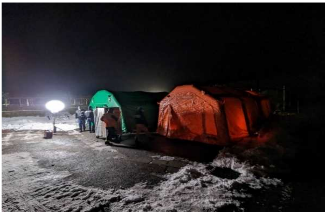
（宿営地での野営風景）