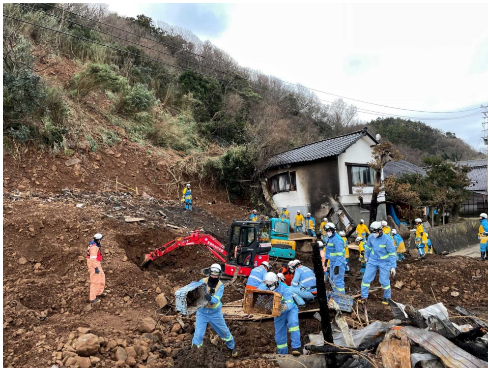
（輪島市名舟町での搜索活動）