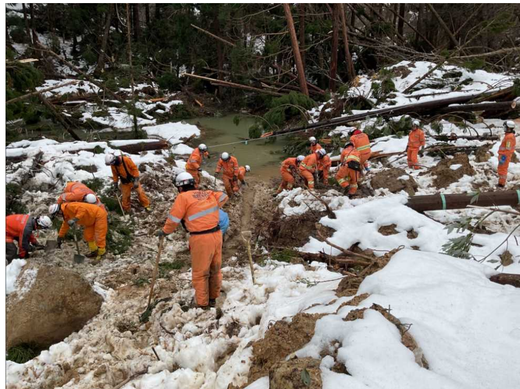
（輪島市町野町での搜索活動①）