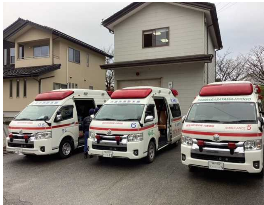
（消防署活動支援・救急隊配備）