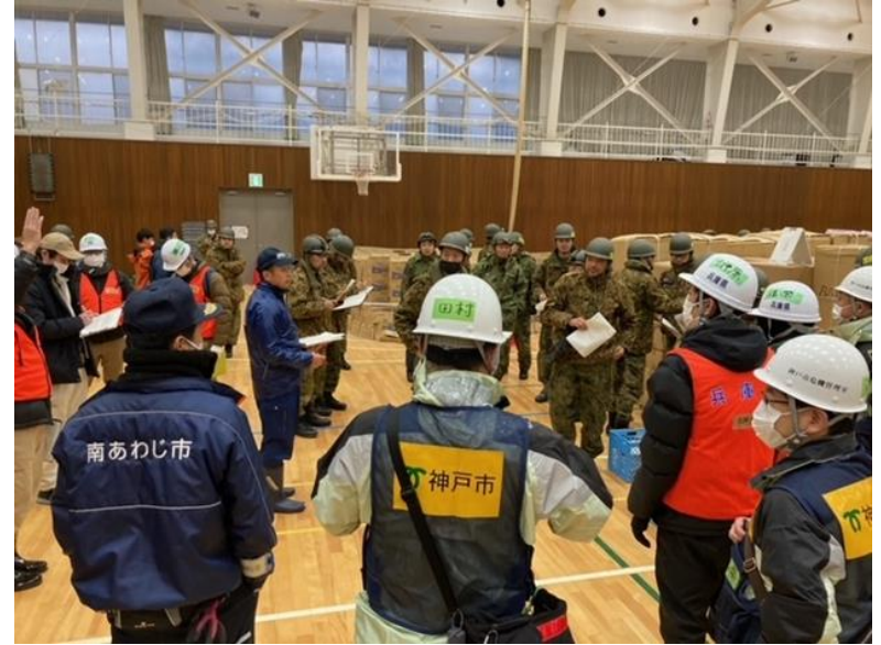
避難所支援チームミーティング(珠洲市健民体育館)