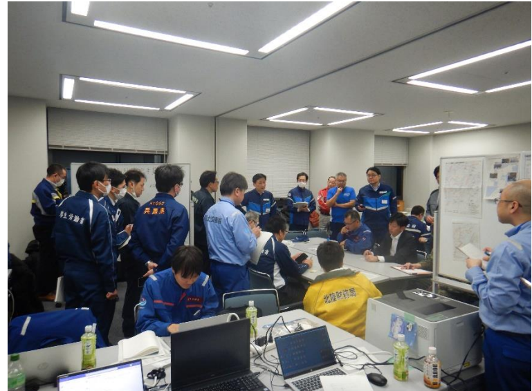
政府現地対策本部との打合せ(石川県庁)