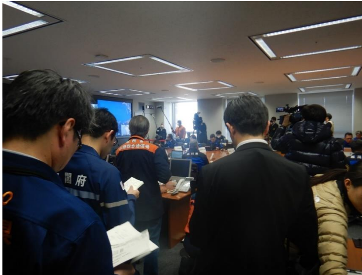
石川県災害対策本部員会議(石川県庁)