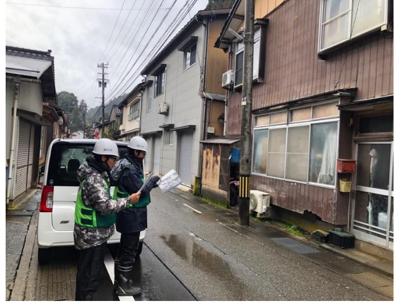
家屋被害認定調査の様子(能登町内)