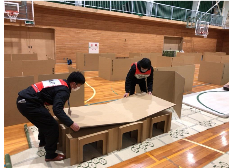
避難所支援(七尾市立中島小学校)