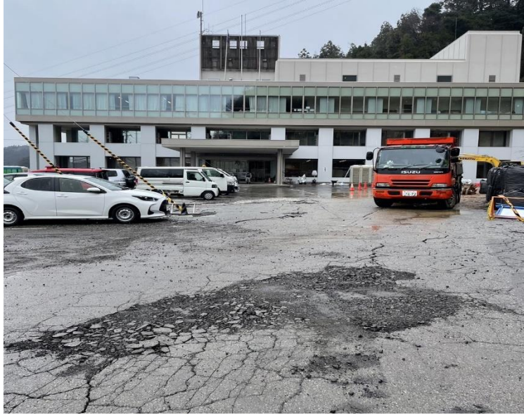
穴水町役場正面玄関