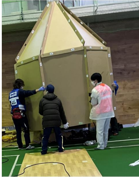
避難所支援(輪島中学校)