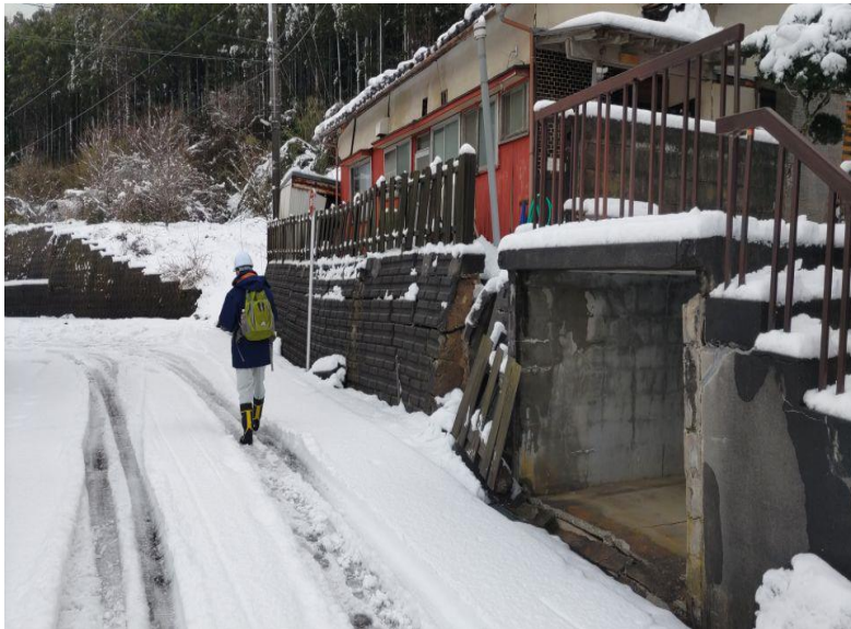
応急危険度判定の様子(志賀町内)