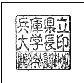
兵庫県立大学長印（播磨科学公園都市キャンパス）