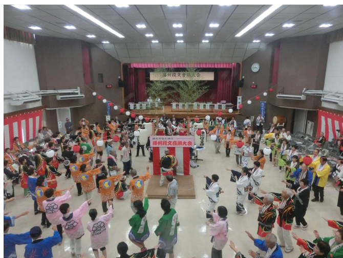
【播州段文音頭大会】