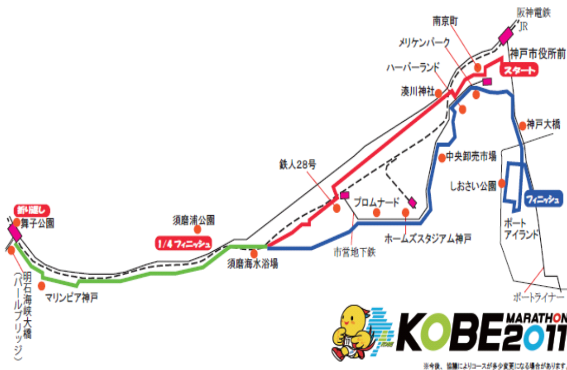
【神戸マラソンコース図】