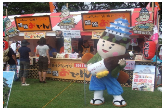
【B-1 グランプリ in 厚木】