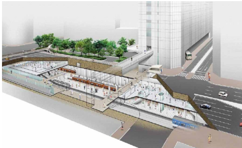
【阪神三宮駅（イメージ図）】