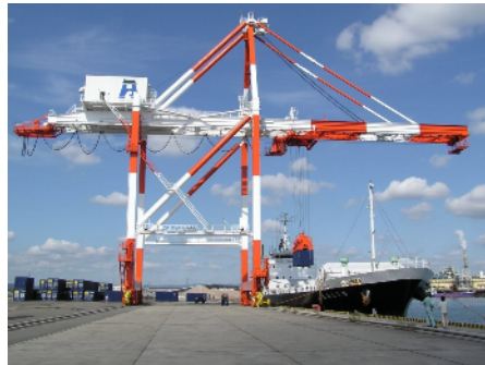
【姫路港広畑地区公共埠頭】