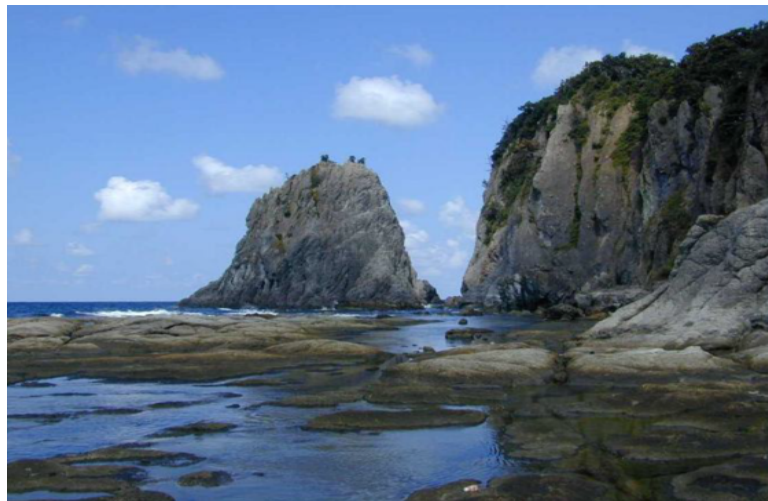
【山陰海岸ジオパーク 今子浦】