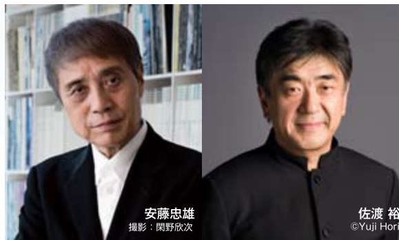
安藤忠雄