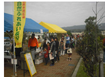
【淡路地域県民交流フェスタ】