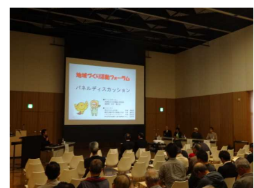
【パネルディスカッション】