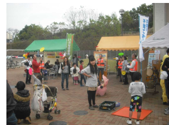
【いざなぎの丘元気っ子フェスティバル】