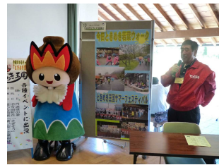
【活動状況の発表・展示】