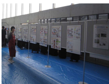
【県民交流広場パネル展示】