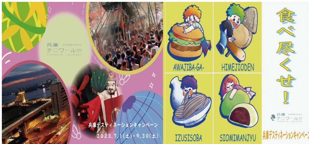
車内吊り広告 (姫新線車内)