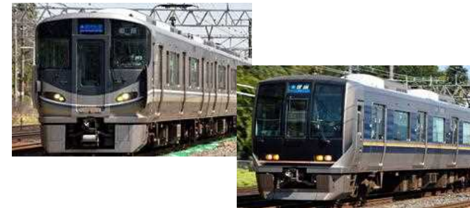
新快速・快速・普通