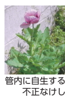
管内に自生する不正なけし

龍野健康福祉事務所食品薬務衛生課 ☎0791(63)5683 ☎0791(63)9234、赤穂健康福祉事務所食品薬務衛生課 ☎0791(43)2937 ☎0791(43)5386