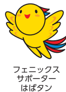
フェニックス サポーター はばタン

近年甚大化する自然災害。その備えに、兵庫県の住宅再建共済制度(フェニックス共済)があります。このたび、加入受け付け・相談会を県民局で開催します。加入希望者は通帳と届け出印またはクレジットカードを用意してください☎6月8日☎、9日☎、11日☎10時~12時、13時~17時☎西播磨県民局総務防災課☎0791(58)2120☎0791(58)2328