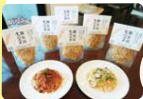
原料も全て純国産の 「加古川パスタ」に 生パスタが登場