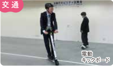
さまざまな交通手段の実証実験の拡大 電動キックボード