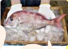
瀬戸内の潮流に もまれて育つ 「明石の桜鯛」