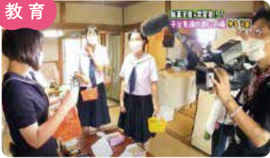
高校生によるデジタルでの地域の魅力発信 (東播磨寺子屋)