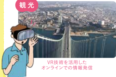
VR技術を活用した オンラインでの情報発信