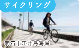
明石市江井島海岸