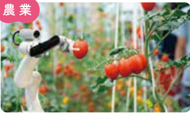
ICTを活用したスマート農業