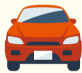
自動車税納期内納付キャンペーン