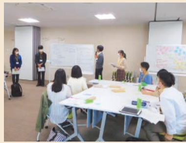
若い世代が希望を語るデザイン会議