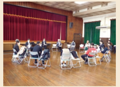
NPO、企業、学生などが将来像を自由に語り合う未来フォーラム