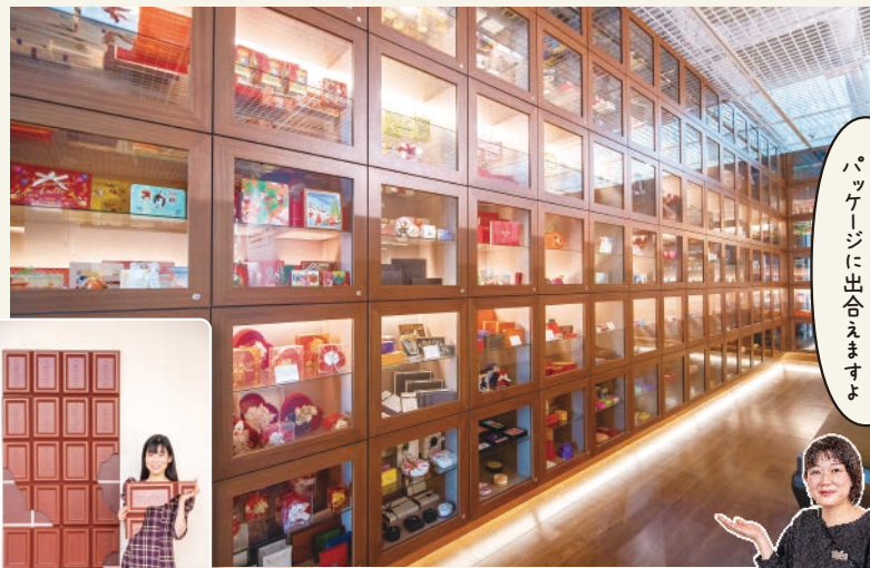
見たことのないパッケージに出合えますよ