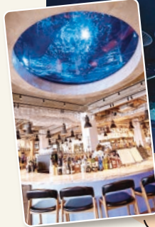
フードホールからは、水族館の水槽で泳ぐ魚たちを頭上に見ることがができます