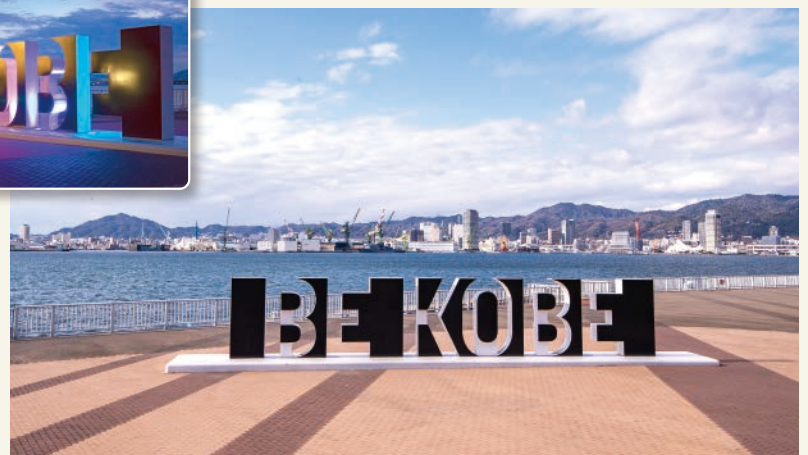
撮影協力:神戸フィルムオフィス

所 神戸市中央区港島1-2-4 所 神戸港管理事務所 ☎078(304)2500 ☎078(304)2504