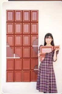
巨大な板チョコオブジェと記念撮影♪