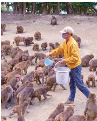
餌を求めて集まるサルたち。

昭和42年に開園した同センターでは、餌付けした野生のサル約300頭を間近で観察することができます。冬季の気温が低くて曇天かつ風の強い日、サルたちは寒さをしのぐために身を寄せ合い「サル団子」と呼ばれる集団を形成します。