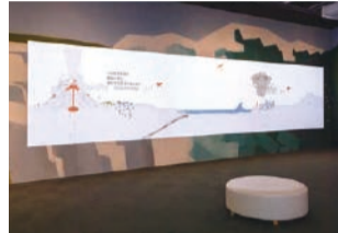
自然現象と人々の生活との関わりを映像で解説。

まず映像コーナーで「地震や台風、火山の噴火などの自然現象と人々の暮らしが交わることで自然災害につながる」ということを理解してから、展示物を通して自然災害が発生するメカニズムを正しく知り、適切な避難のタイミングや方法を学ぶ流れとなっています。