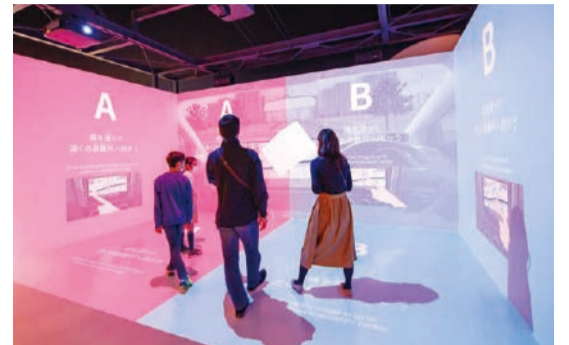
避難時の判断力を問う二択クイズ。

人と防災未来センター 神戸市中央区脇浜海岸通1-5-2 ☎078(262)5050 ☎078(262)5055 9時30分～17時30分 (金曜、土曜は19時まで) 月曜(祝休日の場合は翌平日) 一般600円、大学生450円、 70歳以上300円、高校生以下無料 ひとぼう 🔍