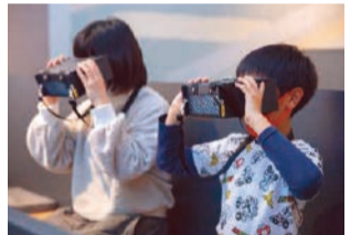
VR映像は専用ゴーグルで観賞。

地震、津波、風水害の災害現場を疑似体験できます。津波の映像では、避難タワーの屋上へ向かいたいののに人が殺到してなかなか上へ行けないというシーンを盛り込み、実際に直面するであろう避難の難しさを表現しました。