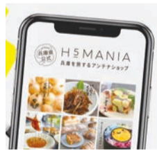
ポイント利用で、 お得に買い物を。

兵庫県では「ひょうごe-県民制度」を活用した特典付与のキャンペーンを実施しています。もともとこの制度は、兵庫県とのつながりを持つていただくために始めたものですが、この制度に登録した上で、ワクチンを2回接種した18歳以上の県内在住または