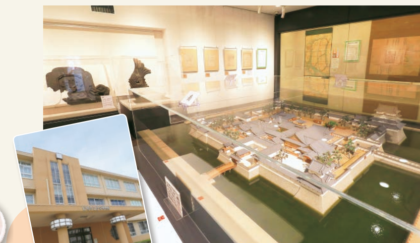
レトロな建物は映画のロケタ使用されたことも。