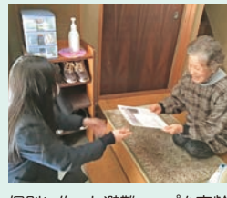
個別に作った避難マップを高齢者宅へお届け。