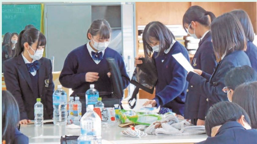
「子どもには、気持ちよく着かせるためにいつも使っているおもちゃ」など、対象ごとに必要だと思う避難グッズを買い集め、実際にリュックに詰めて確認。