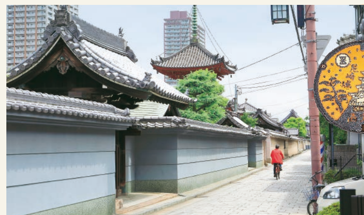
通りには尼崎城のデザインマンホール。