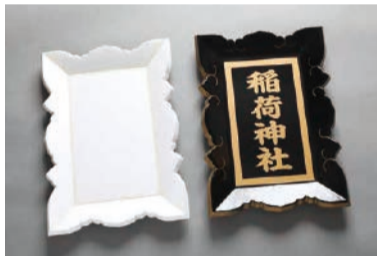
発泡スチロールの素地に表面保護用のウレタンを吹き付け、塗装を施します。

龍野コルク工業(株) 〓 たつの市龍野町島田321 ☎0791(63)1301 ☎0791(63)3106 ●設立/昭和33年 ●従業員/50人