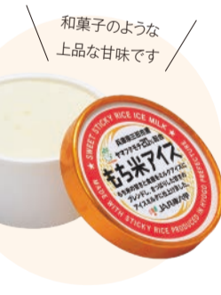
和菓子のよう上品な甘味です