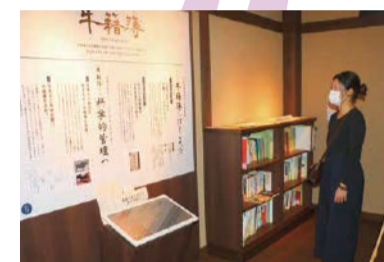
牛籍簿には生年月日や親牛の名前、毛色などが記されています。

県立但馬牧場公園 ◎新温泉町丹土1033 ☎0796(92)2641 ☎0796(92)2640 但馬牧場公園