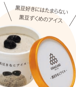
黒豆好きにはたまらない黒豆すくめのアイス