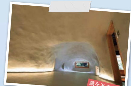
繭をモチーフとした寝室。