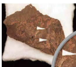
3階の「丹波の恐竜化石」コーナーで実物を展示中。

県立人と自然の博物館 ◎三田市弥生が丘6 ☎079(559)2001 ☎079(559)2007