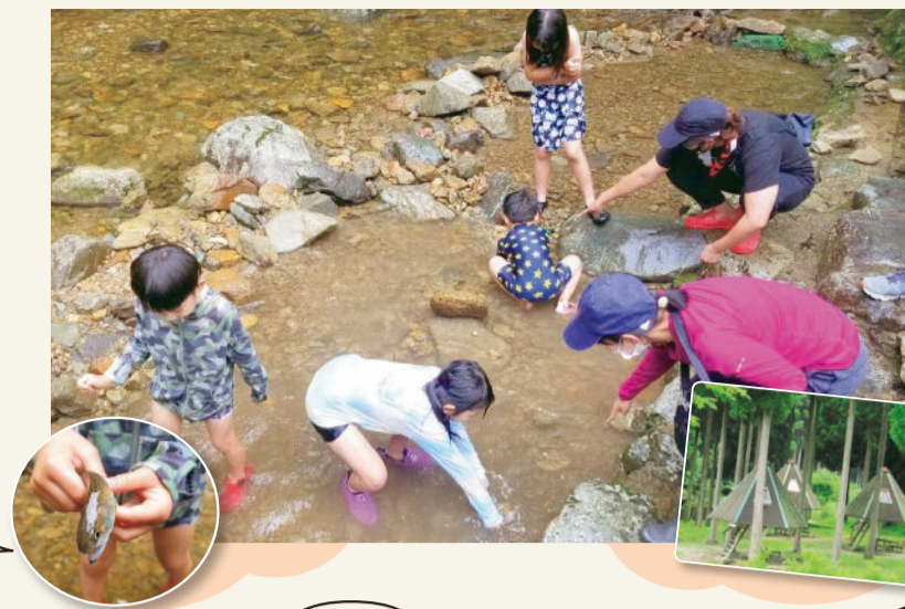
アマゴつかみは10月まで実施。

④神河町新田340-1 ⑤9時~17時 ⑥入材料:大人300円、3歳~小学生200円。アマゴつかみ:500円(約10匹)2,500円。バーベキュー:1,000円(施設利用料) ⑦水曜(祝休日、夏休みを除く)、年末年始 ⑧0790(33)0870 ⑨0790(33)0871