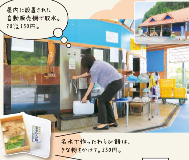
屋内に設置された自動販売機で取水。20℃150円。

④神河町大畑23-1 ⑤9時~17時 ⑥年末年始 ⑦0790(31)5508 ⑧0790(31)5507