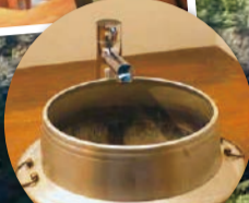
古い釜を活用した洗面台も。