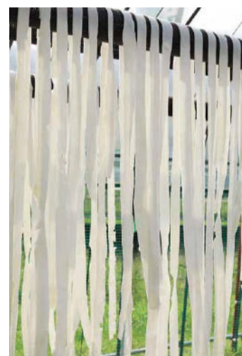
ビニールハウス内に干したかんぴょう。夏の訪れを告げる景色です。

かつて相生市野瀬地区ではかんぴょうの生産が盛んに行われ、その味は大阪の仲買人が競って買い付けに来るほどでした。しかし、戦後の最盛期には50軒ほどあった生産農家が今では数軒に減少。このままでは伝統の素材が廃れてしまうと、4年前、復活を目指し、栽培を始めました。5月に苗を植え、約2カ月後に実を収穫。