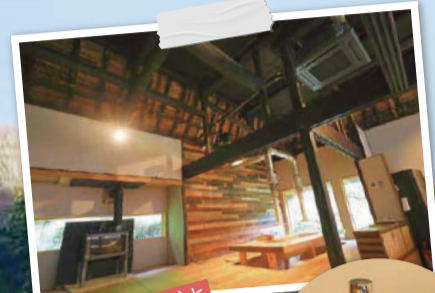
古色を帯びた柱や梁(はり)と、モダンな内装が調和しています。