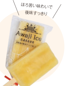
ほろ苦い味わいで後味すっきり