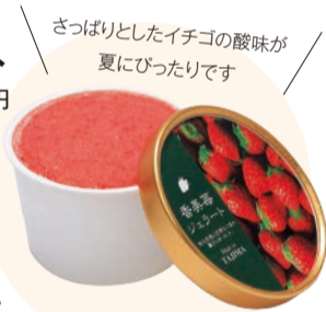
さっぱりとしたイチゴの酸味が夏にぴったりです