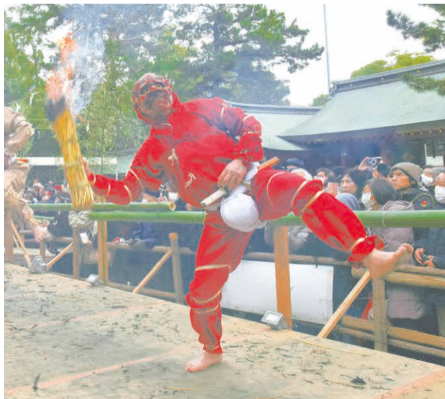
冬空の下、たいまつを手にした鬼が演舞を披露。

① タイプの異なる2種類のオーディオシステムを備えたリスニングルームでは、好みの音楽をじっくり鑑賞。レコード盤の持ち込みもOK。 ② レコード針の組み立てや検品などミリ単位の精度が求められる手作業を見学できます。 ③ 旬の地元食材を使ったランチは、提携する町内のホテルや旅館などから取り寄せ。「松葉ガニを食べたい」などリクエストも可能(別途料金)。