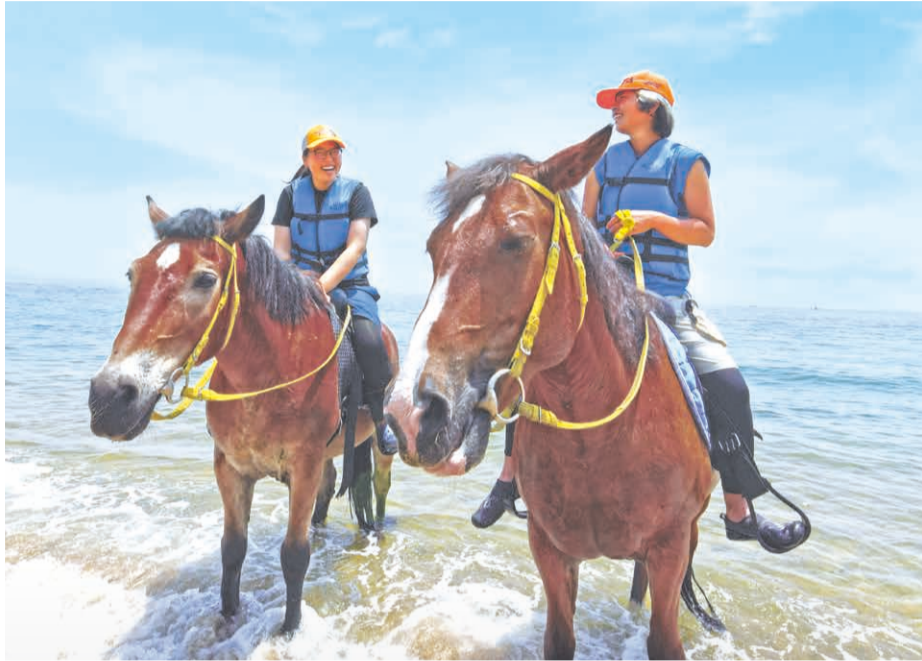
馬はよく訓練されているため、安心して騎乗できます。夏限定の「海泳ぎ」コースは、海が大好きなポニーが担当。

9月まで展開中の兵庫デスティネーションキャンペーン。淡路市の「ハーモニーワールド」では、初めての人も乗馬体験が楽しめます。施設の内外を散歩する3コースに加え、期間限定で馬に乗ったまま海に入る「海泳ぎ」コースも。馬上から、いつもとは違う目線で淡路島の美景を眺めてみませんか。((公社)ひょうご観光本部)