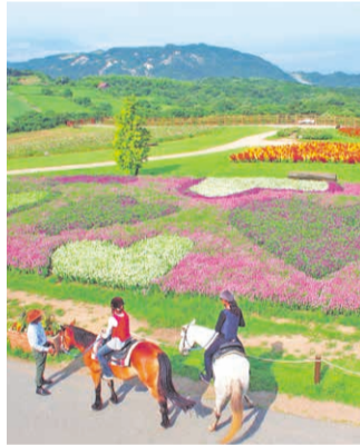
人気の「花さじき散歩」コース。馬上から眺める花畑は格別です。※開花状況は時季によって異なります