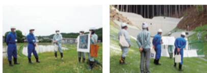
ため池の点検 人家裏山の治山ダムの点検

県では災害予防のため山崩れなどの災害危険箇所を指定しています。普段から家族や地域ぐるみで、近くの危険箇所や避難場所を話し合い、実際に自分の目で確認しておきましょう。特に、近年に災害を受けた所やその周辺では、大雨などの気象情報に注意し、危険を感じたら安全な場所に避難しましょう。