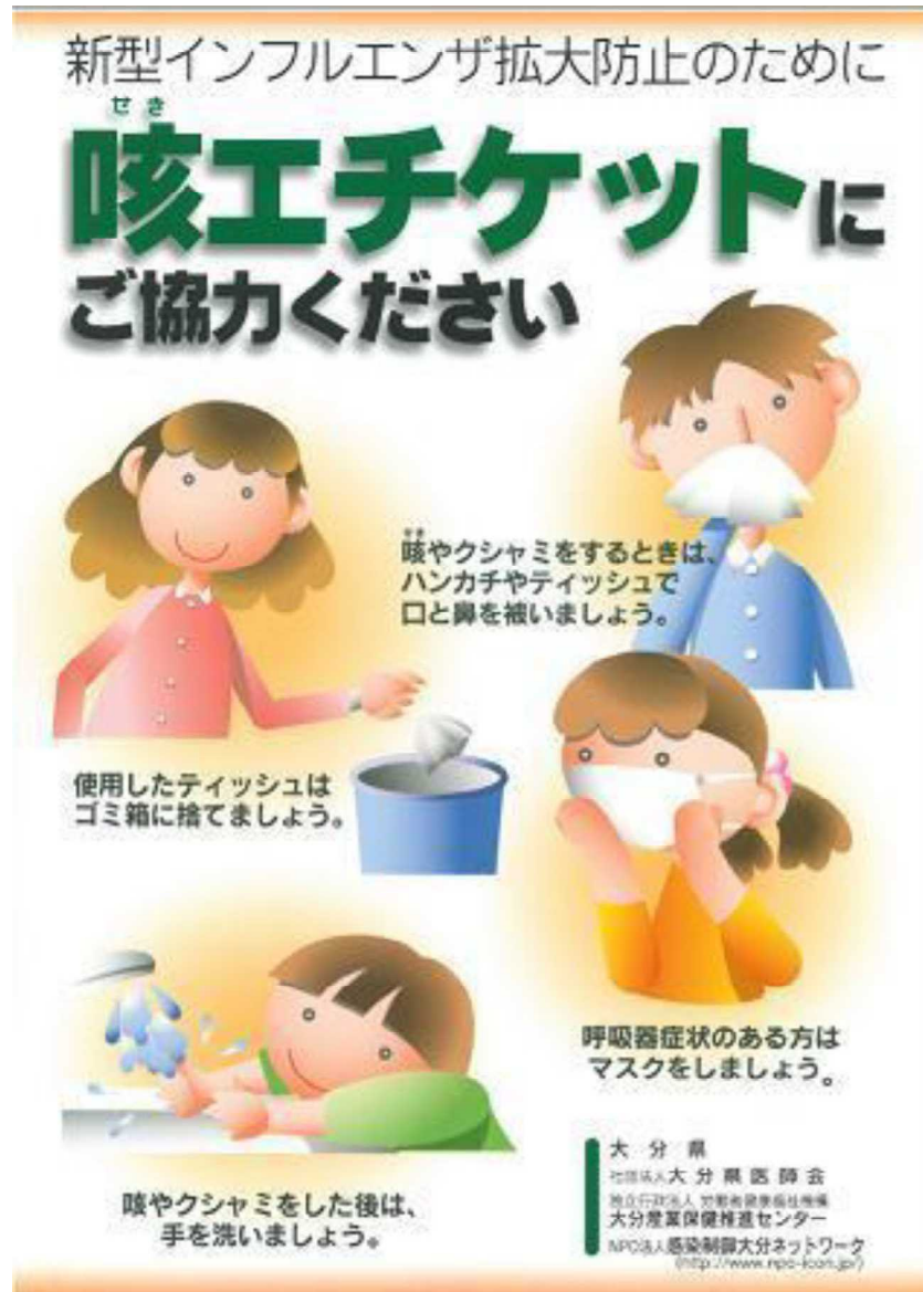
「咳エチケット」のポスター（例）