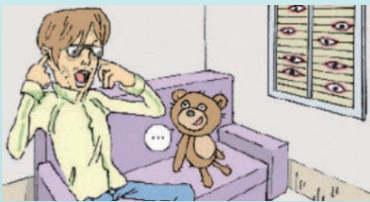
幻覚、妄想等の症状が出る

大麻に含まれる THC(テトラヒドロカンナビノール) が脳神経のネットワークを切断し、やる気の低下、幻覚作用、記憶への影響等を引き起こします。