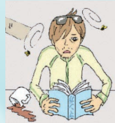
ものを考えられなくなる