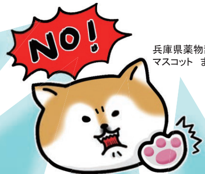
兵庫県薬物乱用対策推進会議 マスコット まやタン