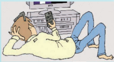
何もやる気がしない