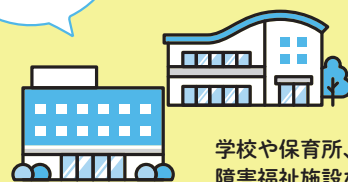
学校や保育所、 障害福祉施設など 関係機関