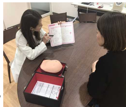
保健師による保健指導

○全社員を対象に保健指導を実施し、日々の体調や生活習慣の確認と健診結果をフィードバック 〔効果〕毎年実施することで、社員のささいな変化や健康面の課題の早期発見に繋がっている