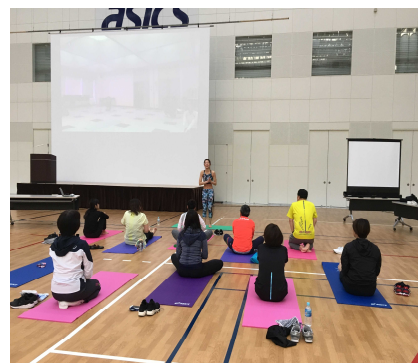
運動セミナー（ヨガ）