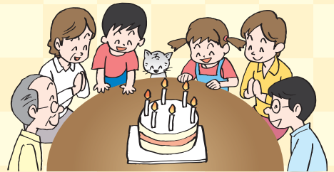
▲誕生日、入学・卒業のお祝いなど家族ならではの行事は、みんなで食事を楽しむよい機会です!