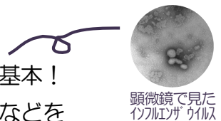
顕微鏡で見た インフルエンザウイルス

健康科学研究所がH30.4に導入した「共焦点レーザー顕微鏡」では、生きた細胞の構造が時間とともに変化していく様子を観察できるので、細菌やウイルスの動きが分かり、薬の作用の研究などにも利用できます。