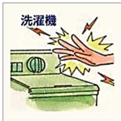
洗濯機を触ると電気のびりびりを感じる…