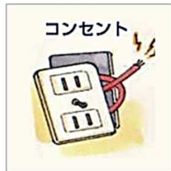
コンセントが破損している…