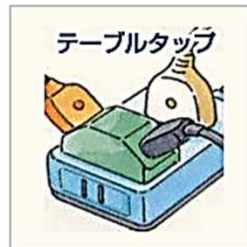
タコ足配線をしていて過熱している…