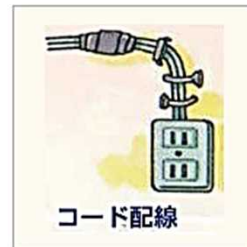
コードを釘などで固定してしまった…