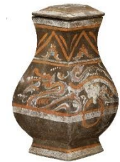
灰陶加彩龍紋釭(漢)

* 学芸員による「ギャラリー・トーク」 学芸員が展示室で実物を前に詳しく解説します。