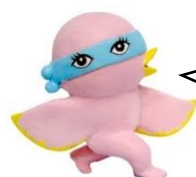
美術館のようせいちゃん