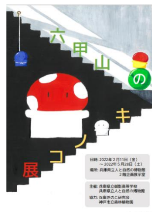
県立御影高校 生徒作成

六甲山系・再度公園（修法ヶ原）において採集したキノコを含浸標本および樹脂封入標本した約100種類を展示し、毒性や薬効性について紹介します。六甲山で特徴的なキノコや特徴のある名前のきのこに着目して展示しているほか、野外で撮影されたキノコ生態写真もパネル展示します。