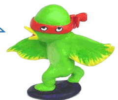
美術館の妖精 イベチャン