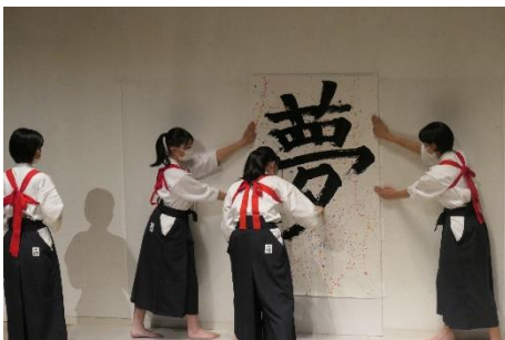
オープニングセレモニー 書道パフォーマンス (県立小野高等学校書道部)

参加した高校生からは、「他の学校の方の意見や質問も自分とは違う視点のものが多く、別の視点をもつことの大切さや良さに気づくことができた」「コロナ禍で気分が沈んでいたが、座談会を通して、前向きに目標を持って生活しようと思った」など貴重な経験になったという感想が多く寄せられました。