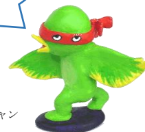
美術館の妖精 イベチャン