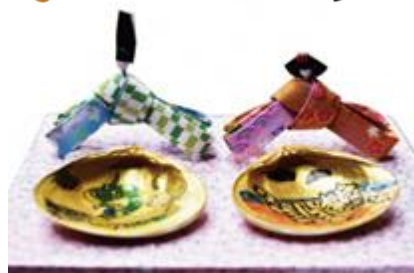
歴はく倶楽部作品例

問合せ先：兵庫県立歴史博物館 〒670-0012 兵庫県姫路市本町 68 番地 TEL 079-288-9011 FAX 079-288-9013 http://www.hyogo-c.ed.jp/~rekihaku-bo